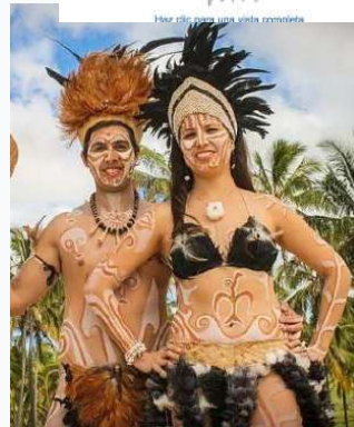
Ejemplo para la pintura del cuerpo