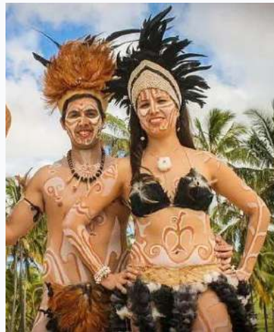
Ejemplo para la pintura del cuerpo